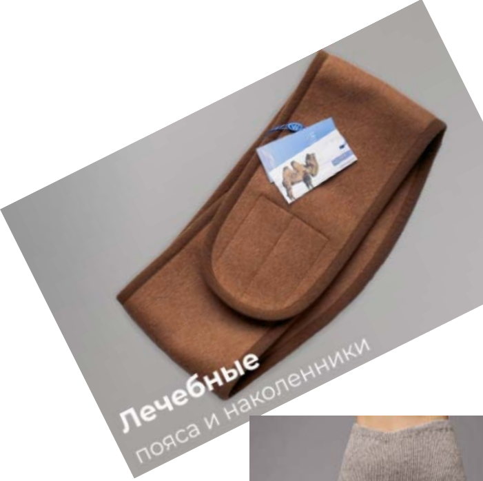
Лечебные пояса и наколенники