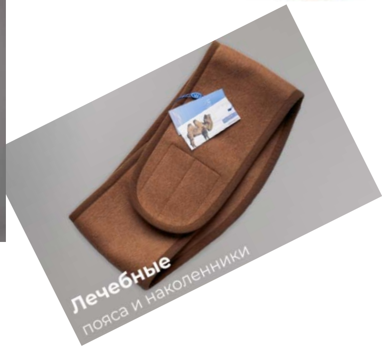
Лечебные пояса и наколенники