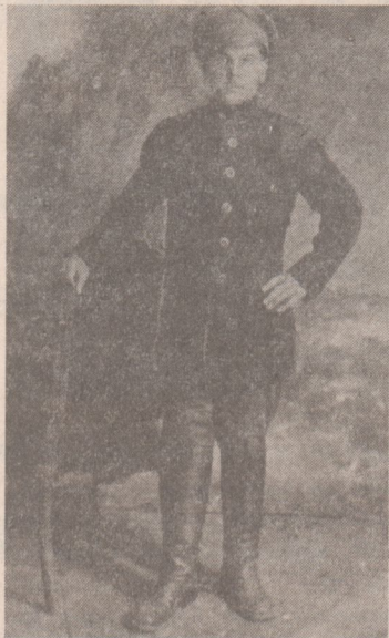
революция! Это было 3 апреля 1917 года.

— Увидел Ленина, когда он шел в сопровождении товарищей. Вот Ильич обратился к рабочим, солдатам. Я, затаив дыхание, вслушивался в каждое слово, всматривался в каждый жест вождя. Ленин закончил свою речь словами: «Да здравствует социалистическая