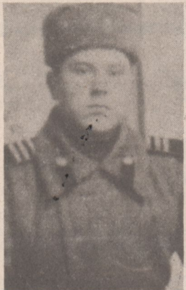
И. М. ГОРБАЧЕВ: