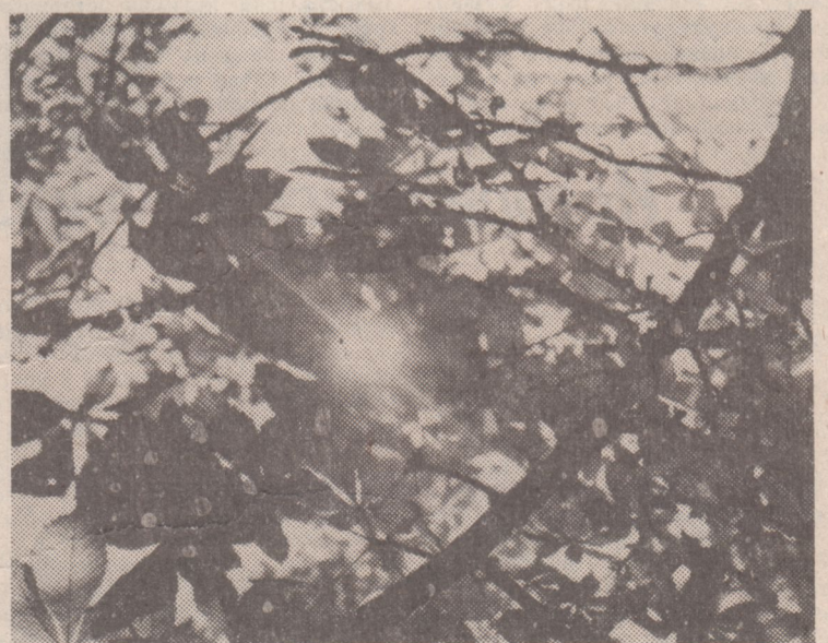
Осенний этюд.

Г. КОССОВА, главный эпидемиолог отдела здравоохранения Гродненского облисполкома.