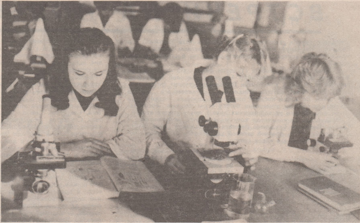
Практические занятия по ботанике.