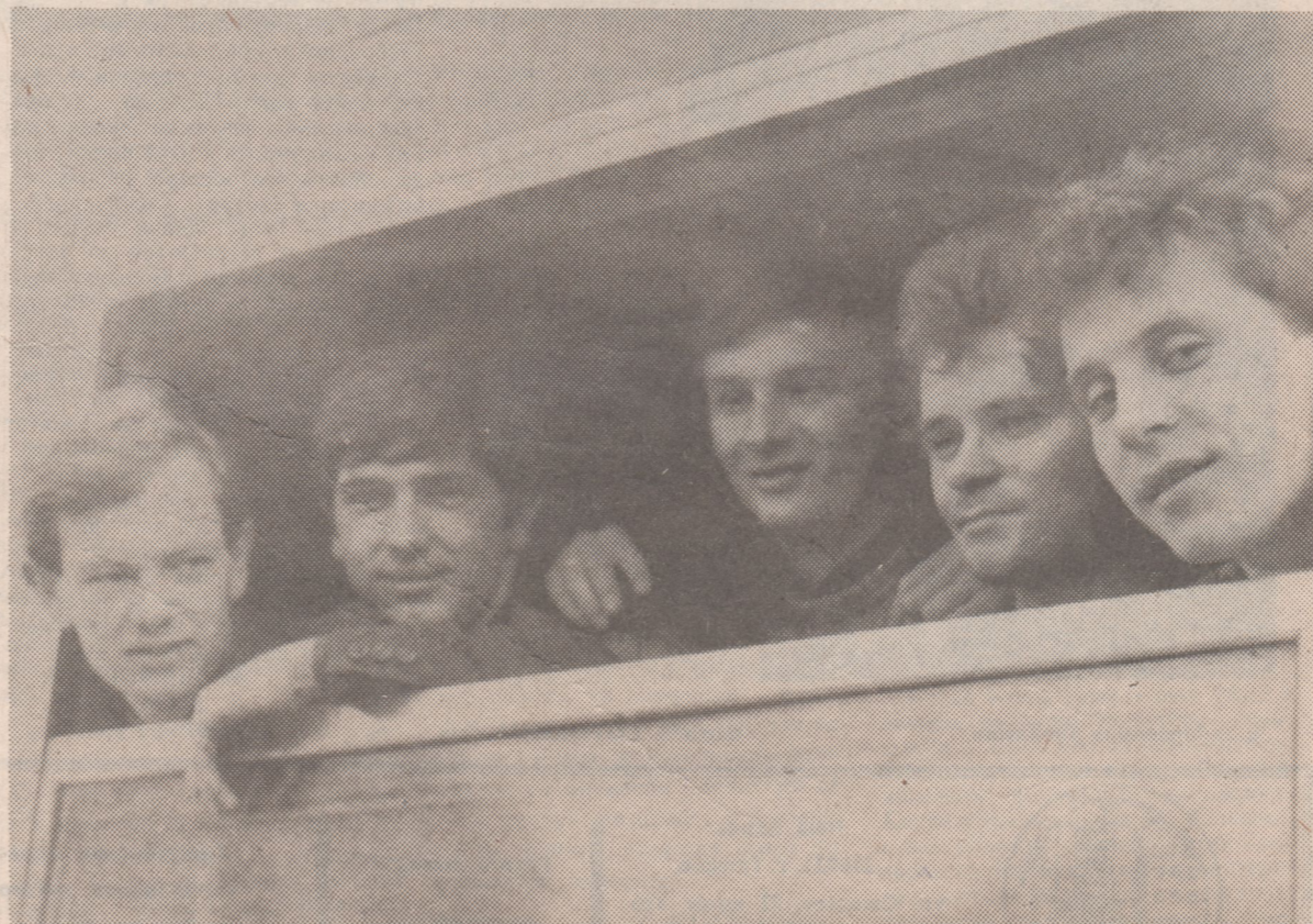
Перед отъездом домой.