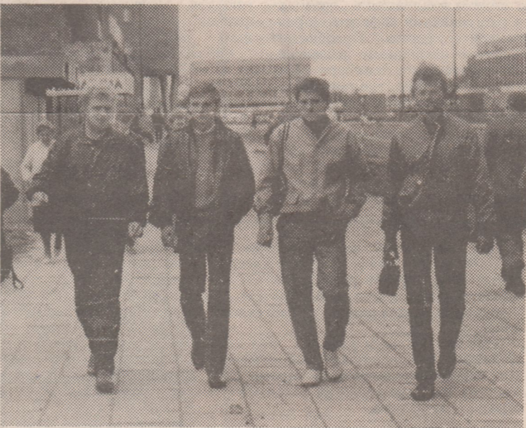
На одной из улиц Белостока.

студент 4 курса филологического факультета.