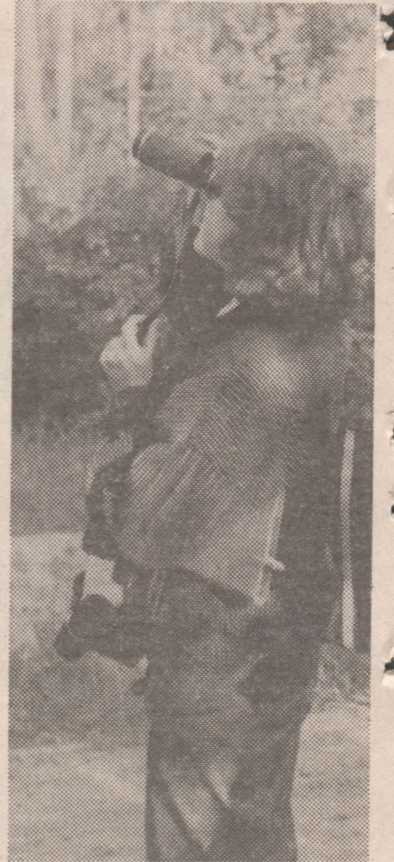
На летней практике по зоологии.