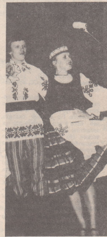
Посмотрите, как увлечены ребята озорной стихией танца!