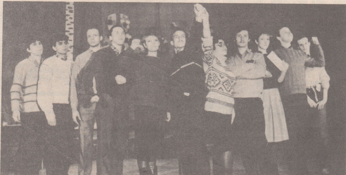
НА СНИМКЕ: Работа над новой композицией (СТЭМ).