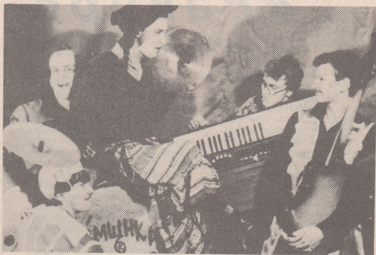
НА СНИМКЕ: СТЭМ — репетиция.

да у нас получится что-нибудь интересное. Я все-таки надеюсь, что в университете найдется немало девушек и юношей, неравнодушных к народному танцу, музыке. Ведь мы на белорусской земле живем.