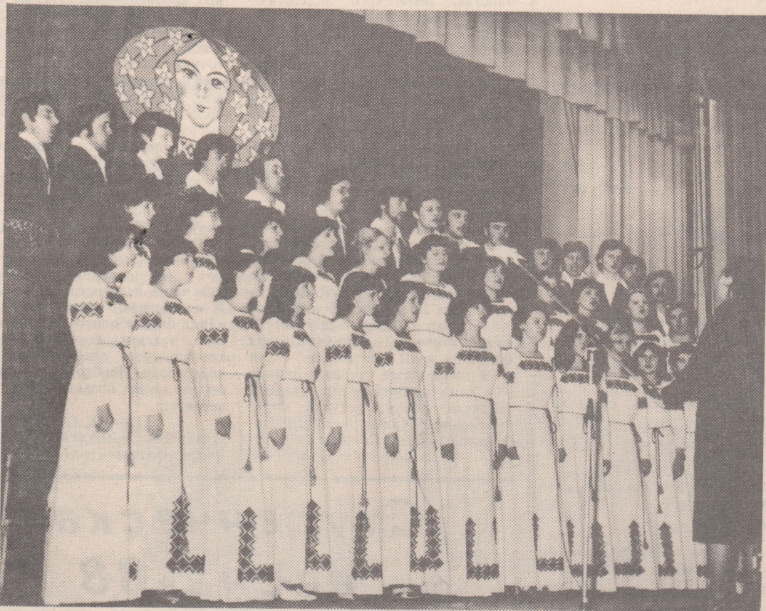
НА СНИМКЕ: хор, как считают руководители ФО Па, — лицо художественной самодеятельности любого вуза.

— Сценарий — это гвоздь наших проблем. Вообще-то, пишем мы его сами. У нас масса идей, но вот объединить их в стройную интересную композицию — это сложно. Нужен