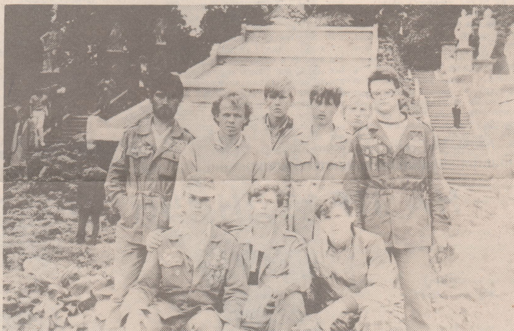
НА СНИМКАХ: ребята из обще университетского отряда «Белая Русь», проводившие свой трудовой семестр на строительных площадках Пскова.

Ехала в студотряд «Спадчына» и представляла: ребята в белых халатах специальными кисточками снимают «пыль веков» с найденных на раскопках. Кревского замка черепков. А все оказалось гораздо прозаичнее: у студентов рабочий инвентарь — обыкновенные носилки, на которых выносятся из раскопа землю, лопаты, ломы и — ни одного белого халата. Поделилась с ребятами своим разочарованием. Они переглянулись: неужто не понимает человек, в каком месте находится?! — и начали экскурсию.