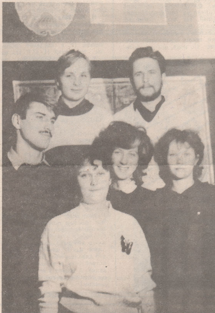
НА ФОТО: студенты исторического факультета, бойцы отряда «Спадчына», победителя соревнования среди отрядов нестроительного направления.