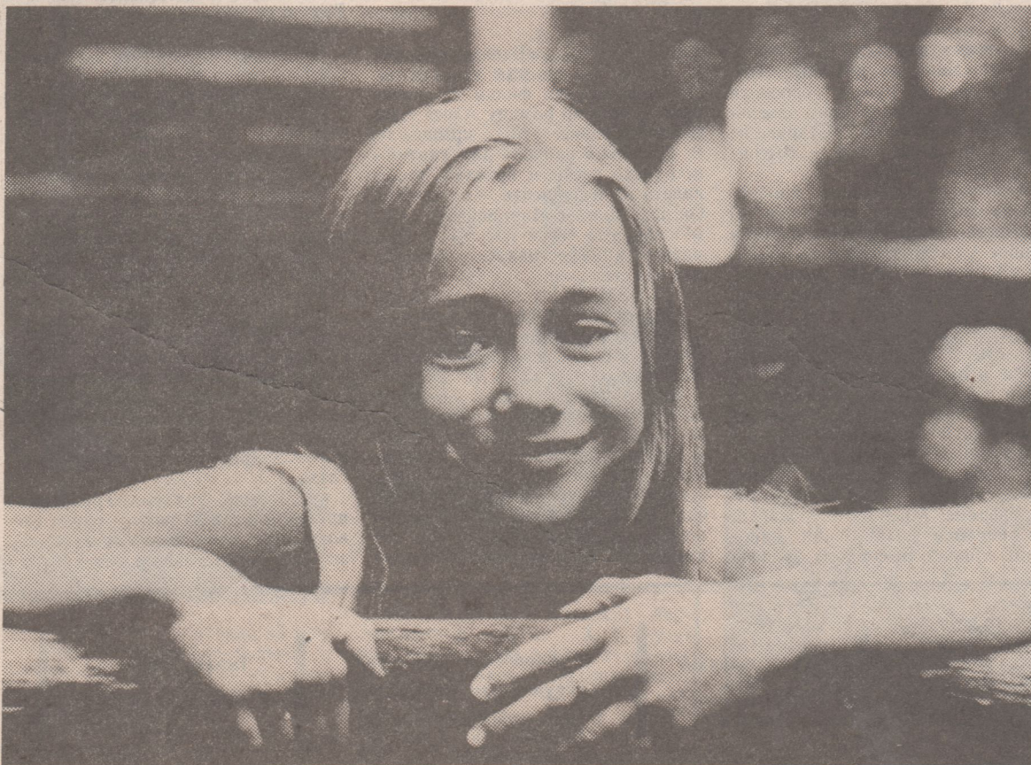
Привет из лета.

Провести автономный совместный сбор ЭНПО «Рубикон» и ГПШ «Данко» на весенних школьных каникулах. Пригласить на него всех желающих, как учащихся, так и студентов, и воплотить все наши мечты.