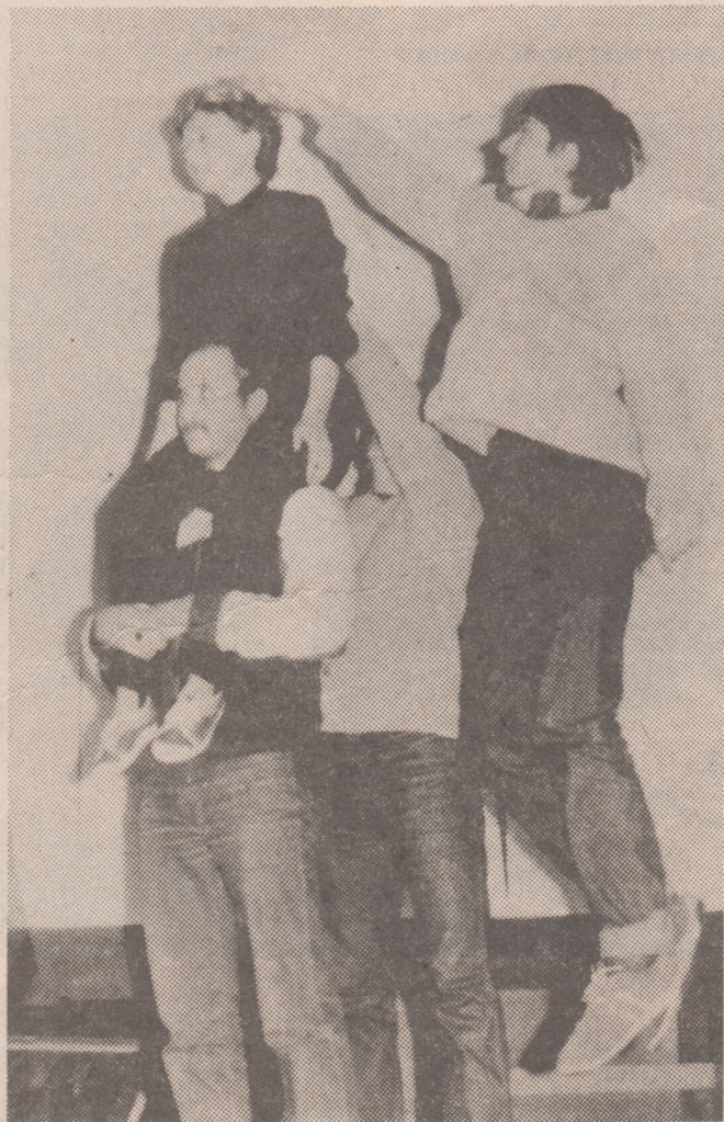
«Рубикон»: «Вам до нас еще дорасти надо.»

приходит сама по себе, как атрибут определенного возраста. Ее нужно воспитывать. И на сложном пути к ней будет набито немало синяков, хватит и слез. Но несмотря ни на что, мы должны гарантировать право на ошибку. Пусть дело не получится, пусть! Но и неудавшееся дело принесет немало пользы, если найти причины неудачи. Подростки испытывают острую нужду в самостоятельности. Формы, в которые они порой облачают ее, нам кажутся смешотворными, нелепыми.