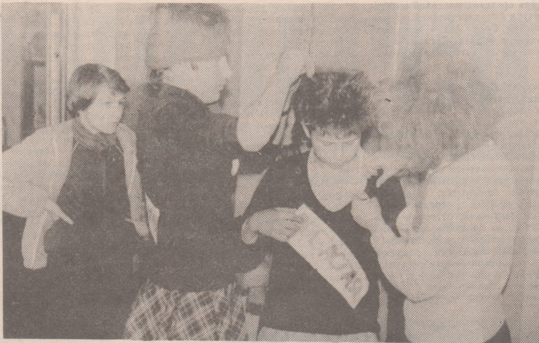
Штатных гримеров нет. Делаем все сами.