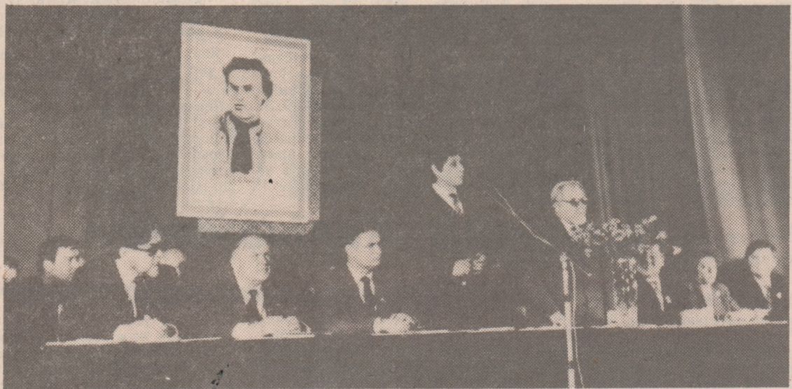
НА СНИМКЕ: в прэзидыуме конференцыі.