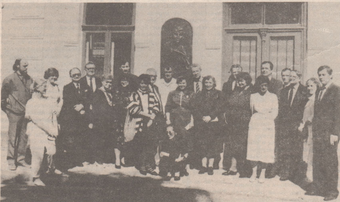
У мемориальной доски, установленной в память о З. Налковской.