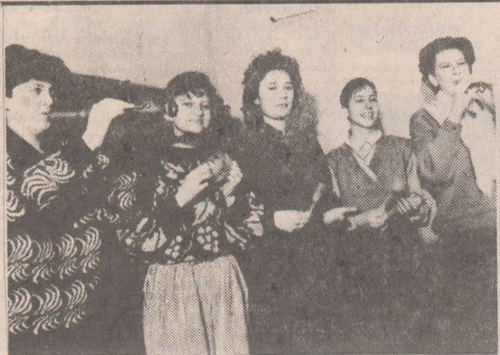
НА СНИМКЕ: участники ансамбля народной песни на репетиции.