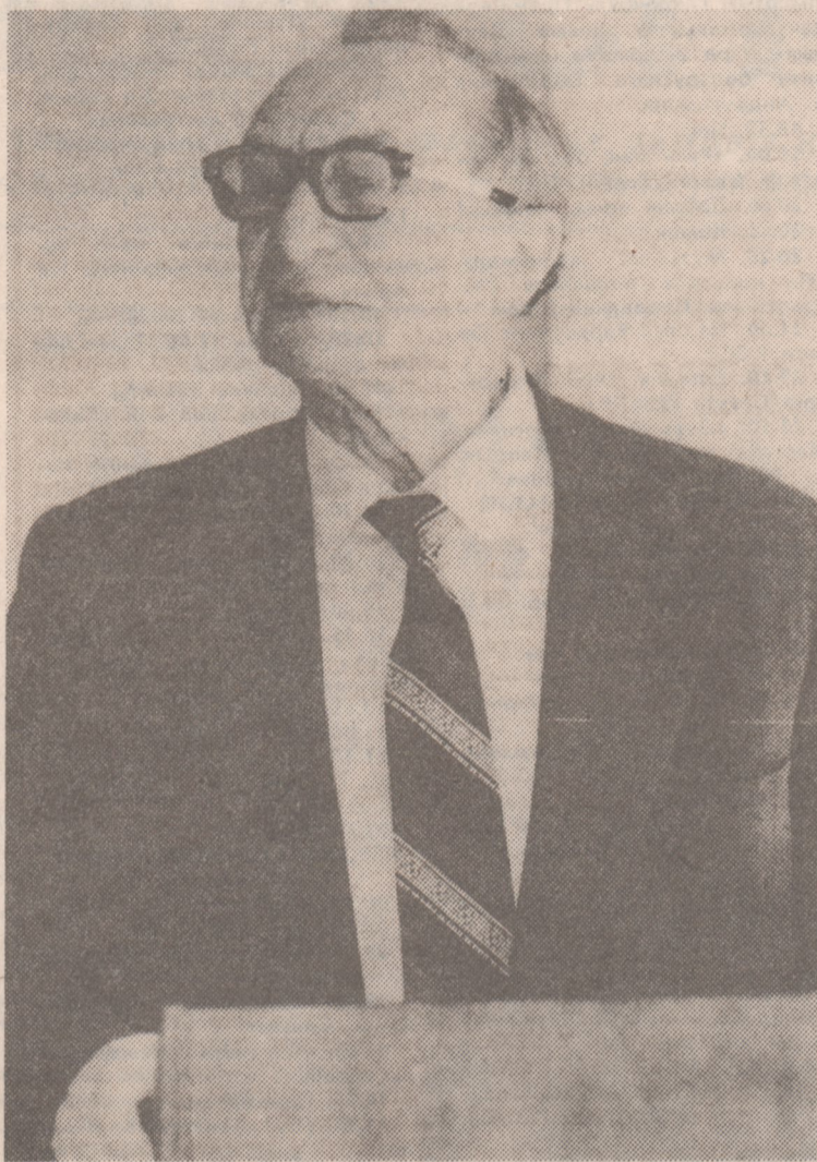
Адно з апошніх выступленняў перад студэнтамі.