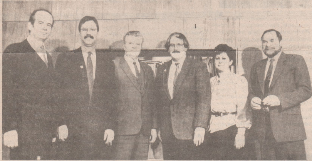
бізнесу ў Гродне); амерыканскія навукоўцы з кіраўнікамі ўніверсітэта.

Best wishes on the establishment of a School of Business in Grodno. Eugene Gomolka