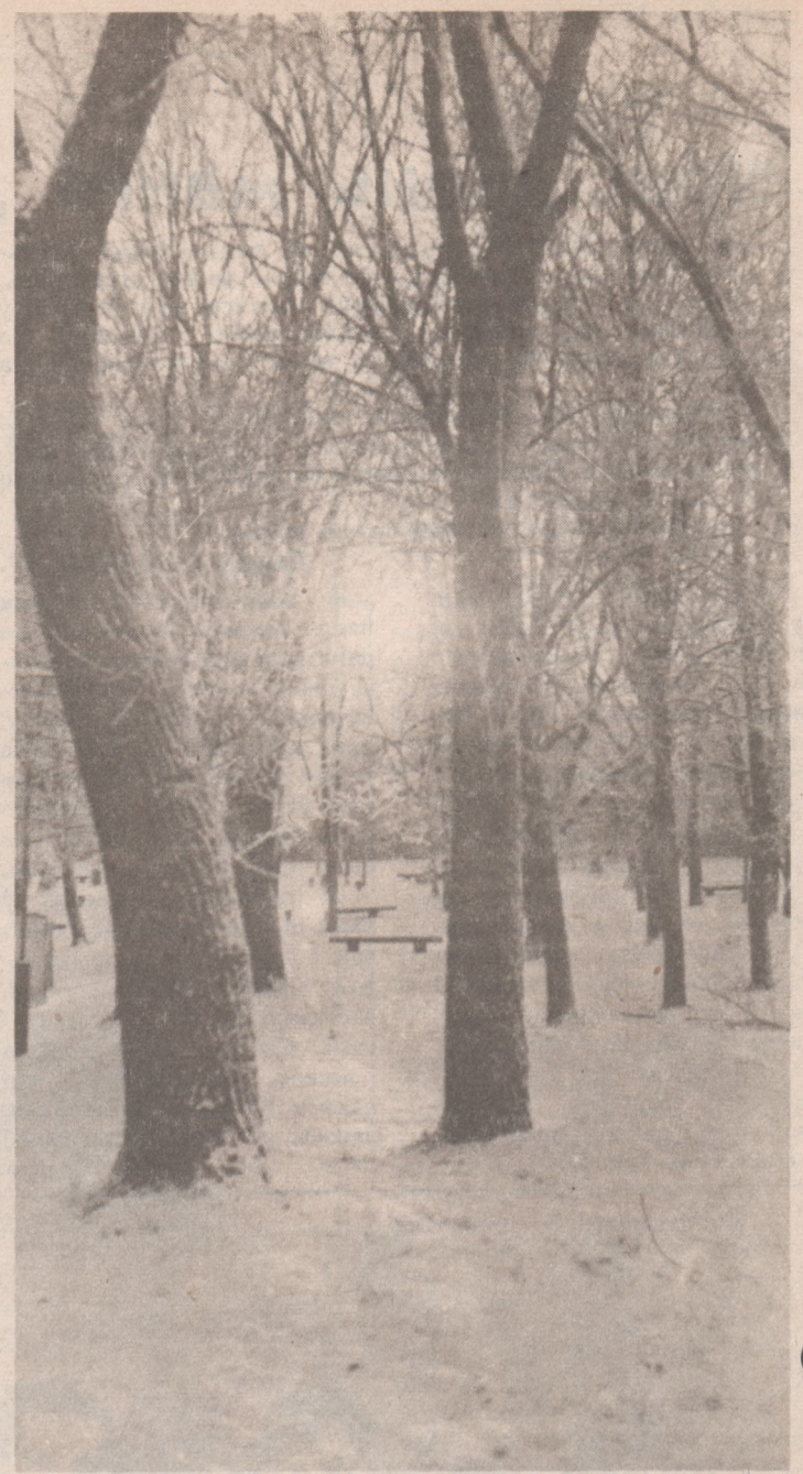
Развітальны подых зімы

Можа, гэта Толькі так здаецца, Можа, гэта — сон, Ці проста — зман вачэй?.. Што ж тады так б'ецца табе, Сэрца... Б'ецца ўсё трывожней і званчэй!..