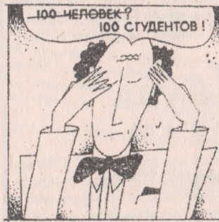
Мал. М. Паршыкава.

Чытачы! Не крыўдуйце на жарт! Лепш вазьміце жартаўніка на заметку!