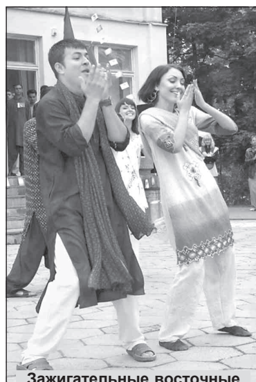
Зажигательные восточные танцы в исполнении студентов медуниверситета.