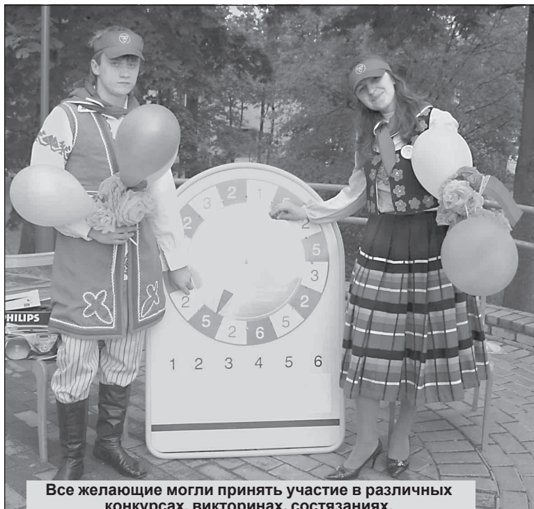
Все желающие могли принять участие в различных конкурсах, викторинах, состязаниях.