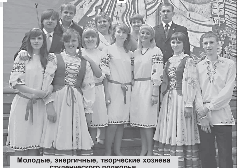
Молодые, энергичные, творческие хозяева студенческого подворья.