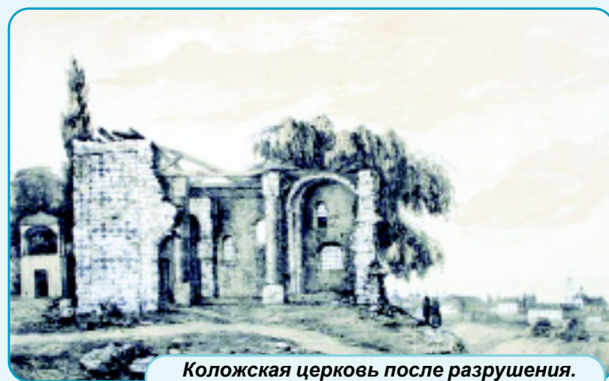
Коложская церковь после разрушения. Литография Н. Орды. XIX век

«Построенный здесь на рубеже XI-XII веков великолепный Борисо-Глебский храм со временем получил от наименования этой местности название Коложский или Коложанский. Об этой древней православной святыне сложено немало легенд, ее всегда современные формы пленяли художников, восторженные строки в разные времена ей посвящали поэты и писатели, несколько поколений историков и краеведов, археологов и архитекторов заботливо воссоздавали забытые страницы ее многовековой летописи, ее неповторимый облик.»