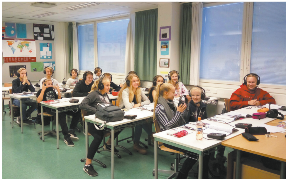
А это класс иностранных языков в финской средней школе.