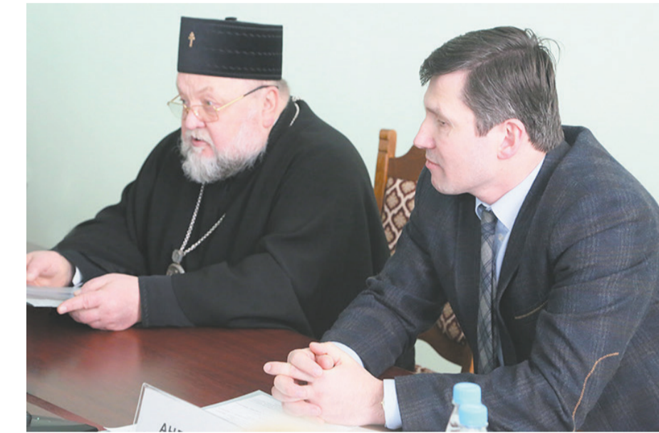
Во время встречи состоялся активный диалог руководства университета с духовенством Гродненского региона.

Архиепископ Гродненский и Волковысский Артемий рассказал, что основная задача встречи – воссоздание духовно богатого человека. Неслучайно подписание программы сотрудничества проходит в стенах ГрГУ имени Янки Купалы: образование символизирует воссоздание образа Бога в человеке. Более того, взаимодействие с купаловским университетом, по мнению архиепископа Артемия, имеет ряд