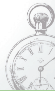
График работы: пн – пт: 08:00 – 19:00 без обеда Выходные: суббота, воскресенье

Запись по телефону: +375 (152) 48-13-84 Адрес: ул. Гаспадарчая, 23 (учебный корпус факультета экономики и управления)