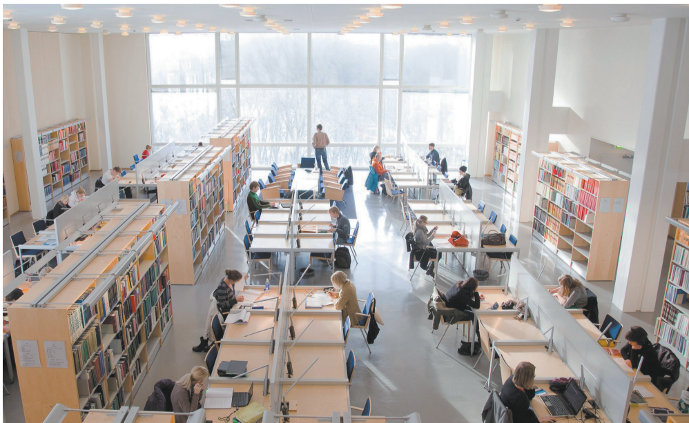
Так выглядит библиотека Университета в Турку.