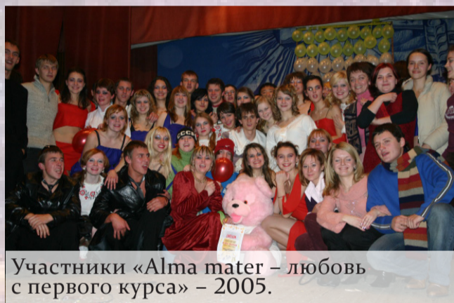
Участники «Alma mater – любовь с первого курса» – 2005.