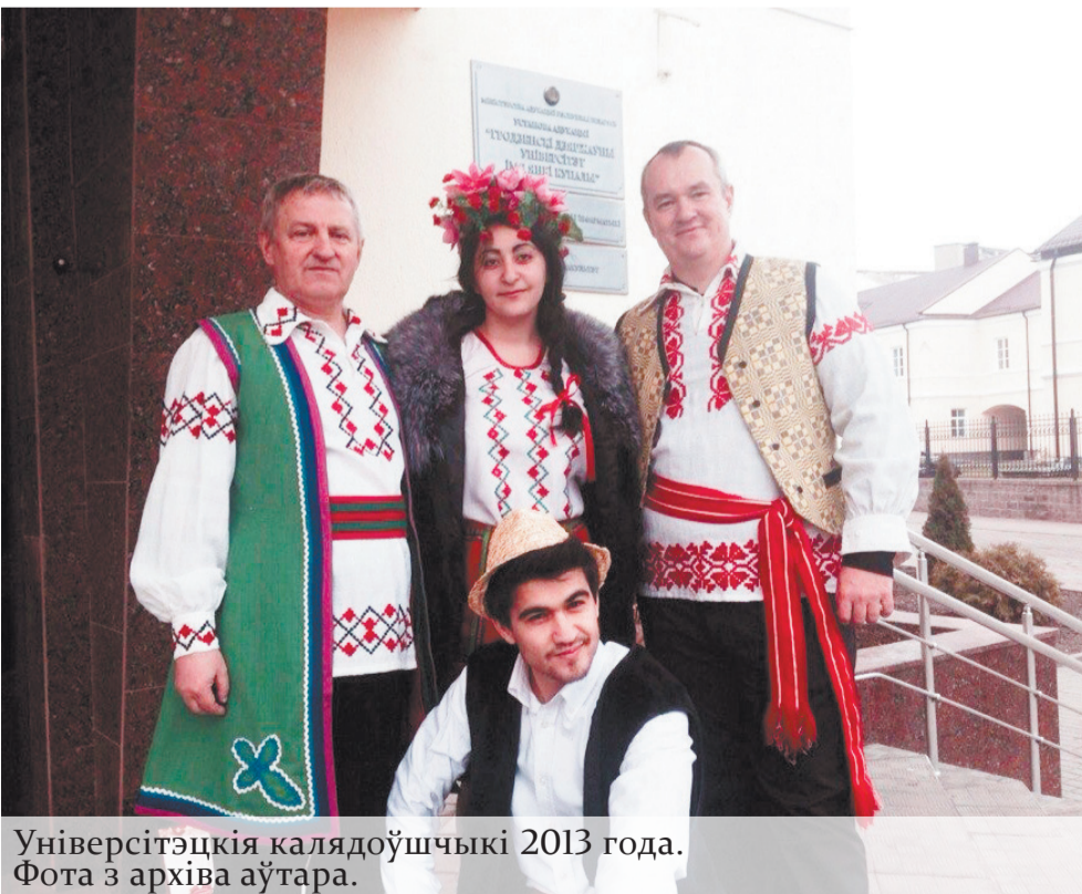
Універсітэцкія калядоўшчыкі 2013 года.