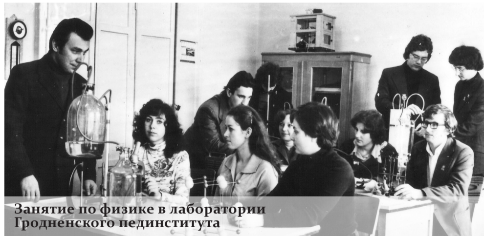
Занятие по физике в лаборатории Гродненского пединститута

Юрий ЗОЛУХИН, Андрей ГЕРМАН.