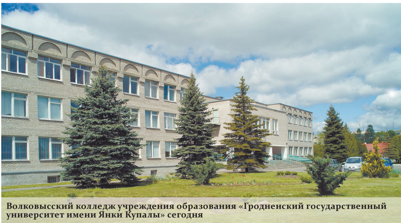
Волковысский колледж учреждения образования «Гродненский государственный университет имени Янки Купалы» сегодня

Коллектив Волковысского колледжа ГрГУ имени Янки Купалы.