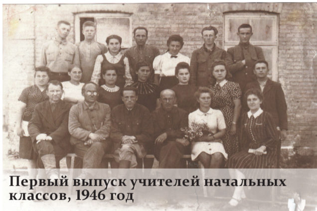
Первый выпуск учителей начальных классов, 1946 год

В июле 1944 года город был освобождён, и уже 20 сентября 1944 года училище возобновило свою деятельность. На 1–3 курсы зачислили более 100 учащихся, а также 40 человек были приняты на подготовительное отделение. К работе приступили и вернувшиеся с фронта 11 преподавателей. В 1946 году состоялся первый выпуск: дипломы Волковысского педагогического училища с квалификацией «Учитель начальных классов» получили 16 человек. Второй выпуск специалистов в 1949 году составил уже 65 человек.