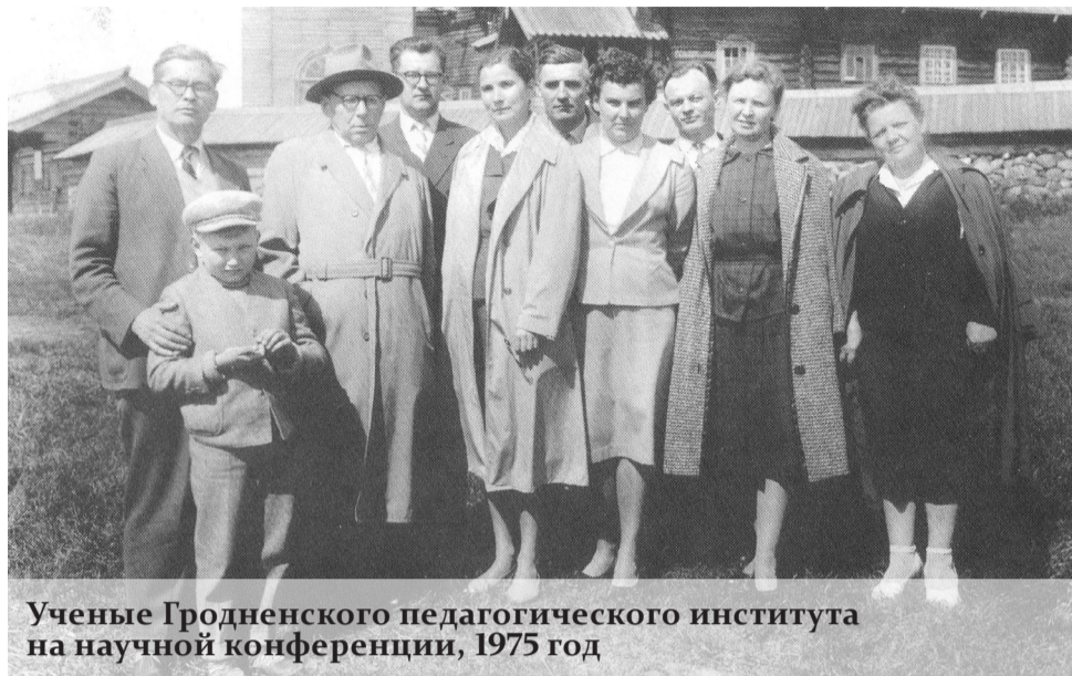
Ученые Гродненского педагогического института на научной конференции, 1975 год

В 1957 году при факультете начала работу «Школа юных математиков». Важным событием явилось создание силами преподавателей в